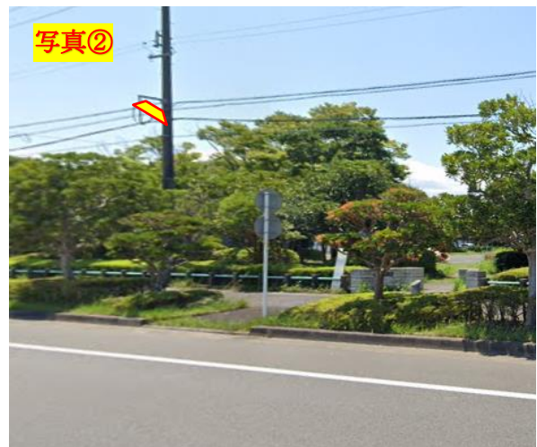
〒422-8035 静岡県静岡市駿河区宮竹1丁目6