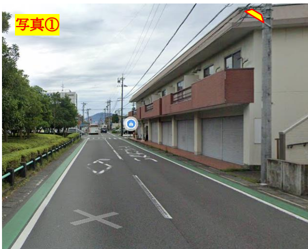
〒422-8035 静岡県静岡市駿河区宮竹1丁目7